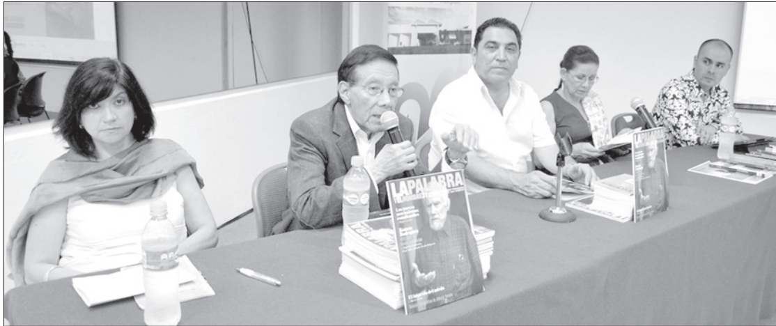
Integrantes del Comité Editorial con el Vicerrector

A través de los años se ha modificado el formato, el diseño, la imagen y el diagramado; cada vez más participan en sus páginas colaboradores jóvenes de