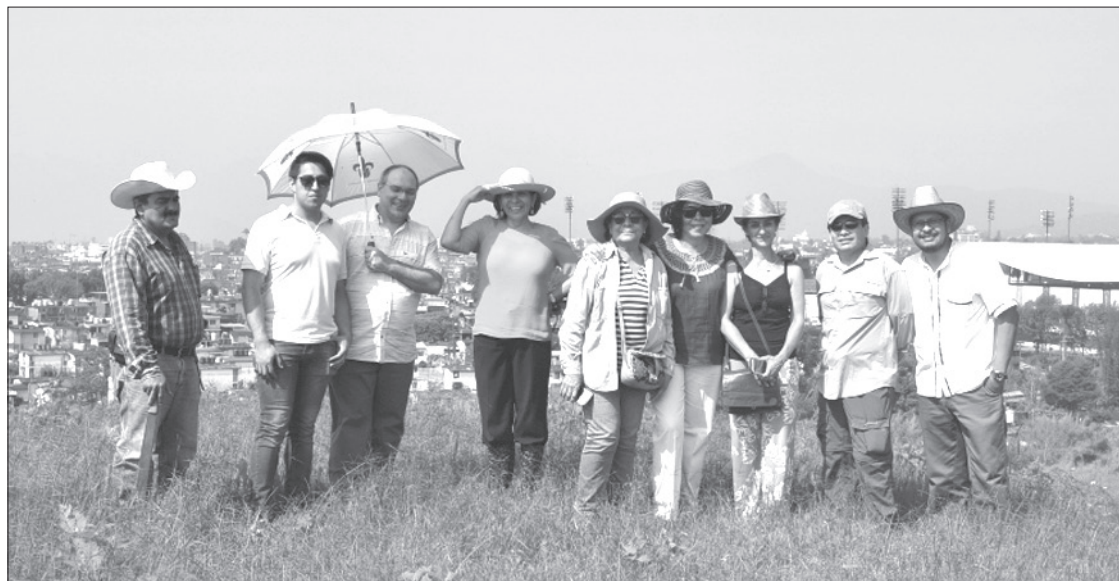
Autoridades universitarias y del INAH recorrieron el sitio