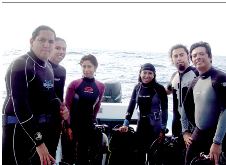
Estudiantes de posgrado ya laboran en instituciones nacionales