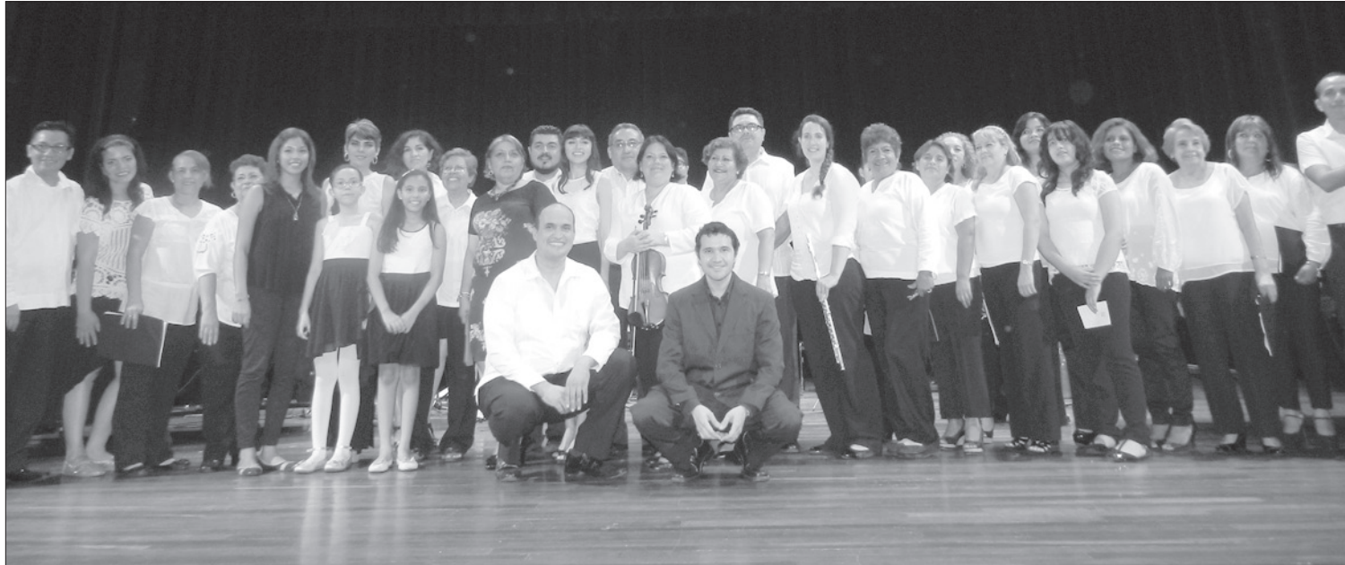
Participaron estudiantes, egresados y padres de familia

Interpretaron piezas de Vivaldi, Mozart, Beethoven y Agustín Lara