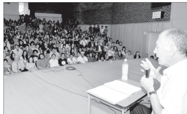
El Auditorio "Jesús Morales Fernández" lució abarrotado

En este sentido, el autor de Educación en la ciudadanía cuestionó si este hiperconsumo logra o no llenar el vacío emocional de las personas alcanzando la felicidad, pues si bien ha favorecido a las economías de los países, no ha sido proporcional al crecimiento del bienestar interno de las personas.