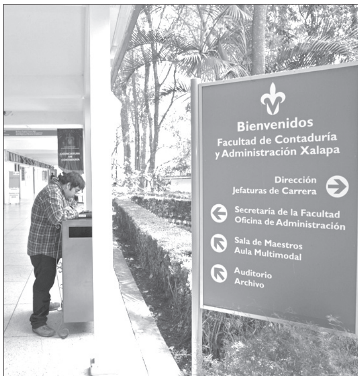
La entidad académica tiene la matrícula más grande de la institución

Al dar un balance de los logros, metas y objetivos alcanzados, tal y como lo señala la Ley Orgánica y el Estatuto General de la UV, Olvera Carrascosa resaltó que el principio fundamental de cualquier gestión debe ser en estricto apego al Marco Normativo que rige a la comunidad universitaria.