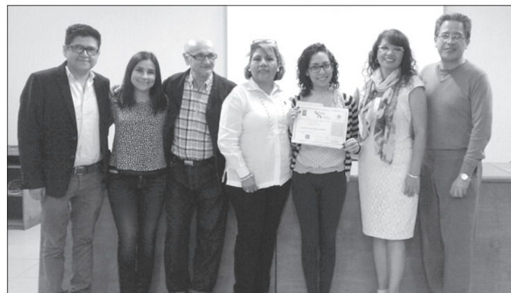
En los últimos años, 81 egresados se han sometido al examen