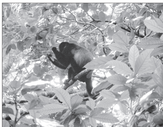
Monos aulladores son afectados por los huracanes

Parte de los modelos incorporados servirán para generar propuestas que de alguna manera incrementan la resistencia de la población de primates a los impactos de los huracanes, por ejemplo, el incremento del hábitat aumentando así la protección física y la conectividad entre fragmentos de hábitat, lo cual permitiría el desplazamiento de los individuos en episodios de alta perturbación.