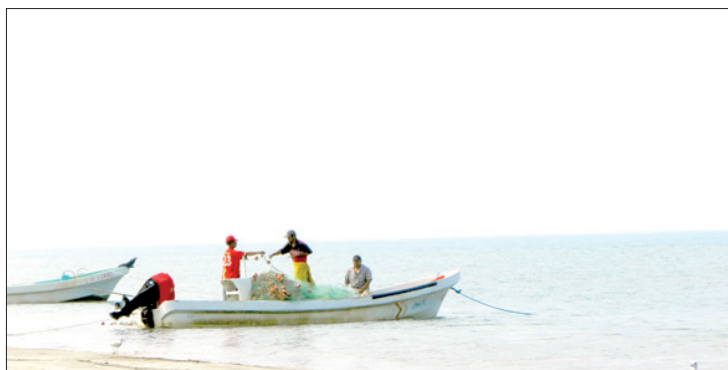
El trabajo con pescadores es parte de sus actividades

Recientemente participan en un comité del sistema producto escama encargado de hacer un diagnóstico, que abarca desde el momento en que se atrapa hasta la comercialización, y realizaron un programa maestro para desarrollar la cadena productiva.