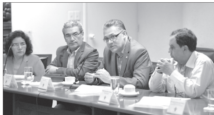
Los evaluadores visitarán los cinco campus de la UV

Detalló que la articulación de las tutorías al interior de la