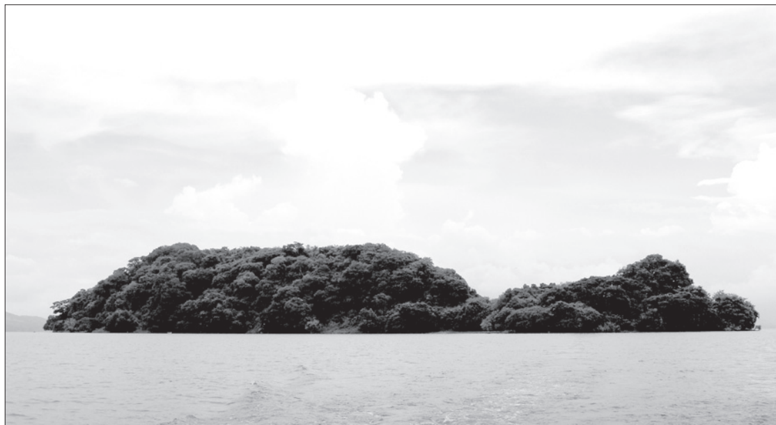
La isla de Agaltepec fue el sistema base del estudio

El tema fue la severidad de los huracanes en las probabilidades de extinción de primates