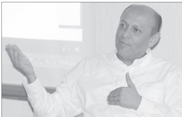
El investigador exhortó a los universitarios a refugiarse en los libros

“Nosotros entendemos el mundo a través de opiniones, y algunos especialistas, filósofos o científicos, construyen