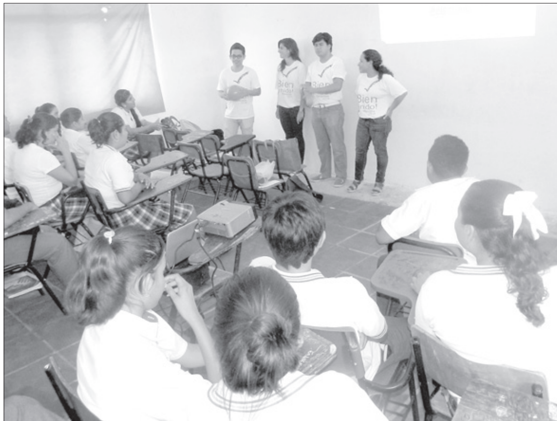
Los jóvenes charlaron sobre autoestima y violencia en el noviazgo