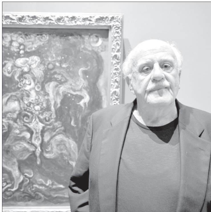
El pintor expone Personas y personajes , en el MAX