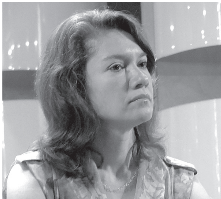
La académica participará en la FILU

Además de sus colaboraciones en programas radiofónicos y en diversos medios impresos, su trabajo como historiadora se refleja en su investigación para la elaboración del libro Banda Sinfónica del Estado de Veracruz, historia y tradición musical , editado en 2010 por el Gobierno del Estado de Veracruz.