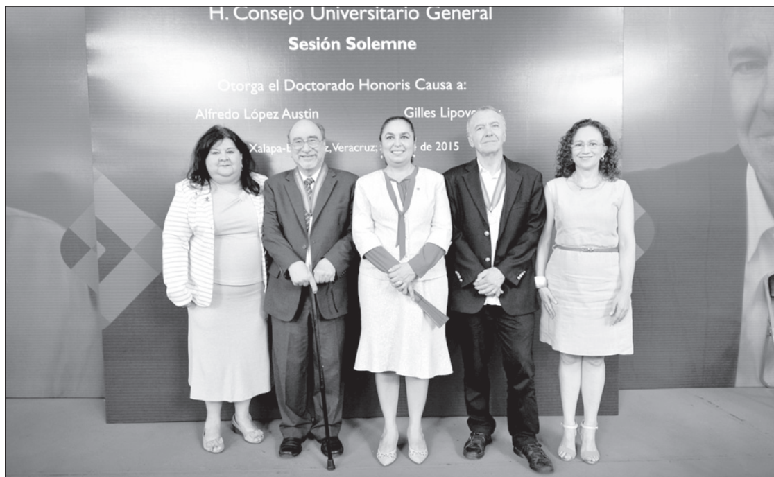
Autoridades universitarias con los galardonados