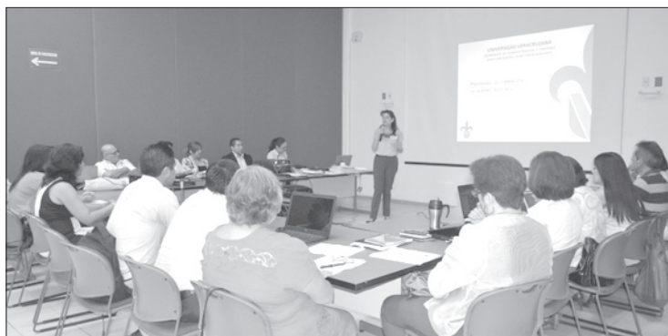
Aspecto de la sesión de trabajo

“El Programa de Formación de Administradores se ha hecho realidad gracias al trabajo desarrollado durante muchos años atrás. Como universidad pública tenemos la responsabilidad de ser muy transparentes, es parte del papel de la administración.”