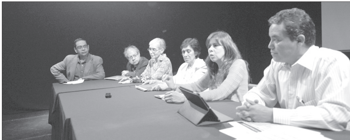
Estos programas educativos forman la masa crítica del país, señalaron

En la mesa de análisis también se exhibió el escenario de las universidades privadas, cuya oferta de posgrados la mayoría de las veces no está certificada en cuanto a su calidad, a diferencia de la oferta de las instituciones públicas.