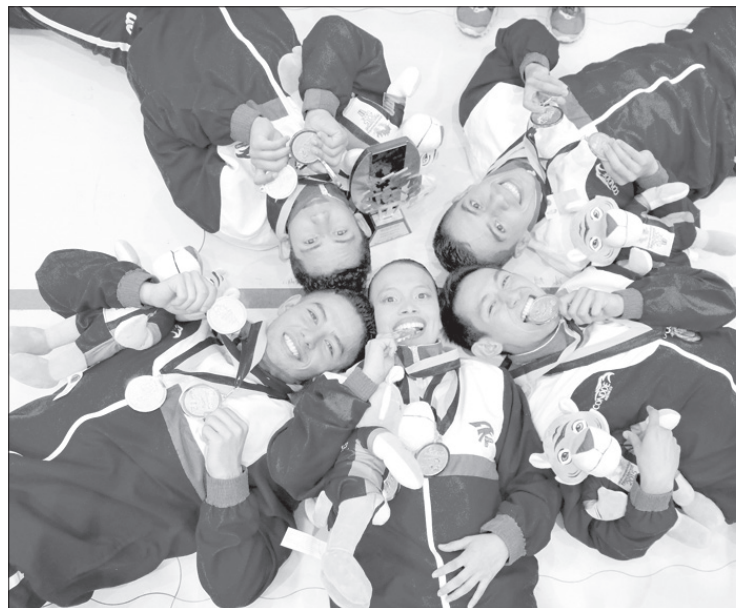
La gimnasia aeróbica dio cuatro medallas

El destacado guardameta compartió que asume el reto de atajar todo lo que se le presente para sacar adelante al equipo: "Me corresponde, es mi trabajo, pero con el apoyo de todos creo que se puede lograr una buena actuación".