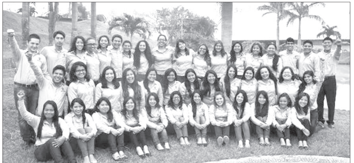
Alumnos de Licenciatura en Gestión y Dirección de Negocios

Enfatizó que existe una problemática social en el país que se manifiesta de diferentes maneras. “La misión de este proyecto es fomentar actitudes y valores necesarios para lograr cambios en los comportamientos en nuestros jóvenes, y uno de los objetivos de la Facultad es que sus alumnos se comprometan de acuerdo a valores éticos”.