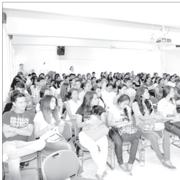
Los jóvenes recibieron información sobre el portal electrónico del banco

En 2014 fue uno de los investigadores que construyeron el prototipo de un nanosatélite CanSat capaz de medir temperatura, presión y humedad, como parte de las actividades realizadas en el marco de la Semana Mundial del Espacio en México, que se realizó del 6 al 15 de octubre.