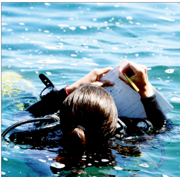
Llevan un registro detallado de sus investigaciones

Los efectos de vientos, descargas de ríos y aportes pluviales, así como