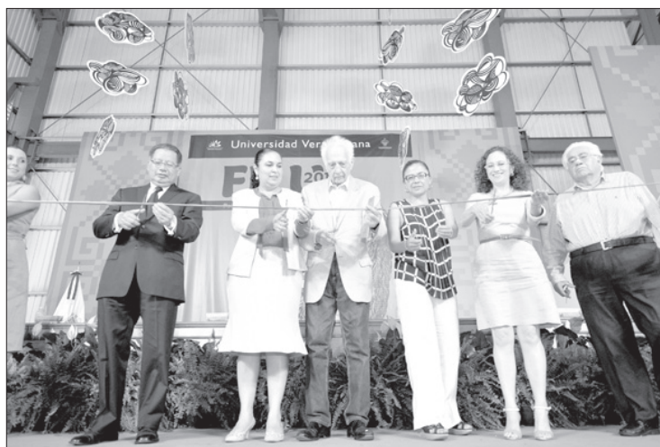
Autoridades universitarias e invitados hicieron el corte inaugural

Ante la presencia de personalidades como Sergio Pitol,