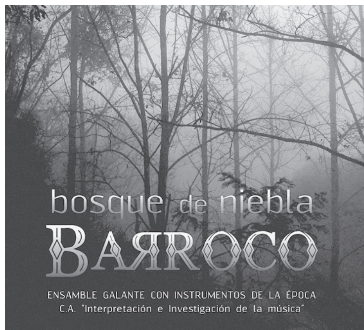
El CD estará disponible para estudiantes de música