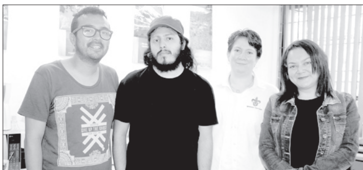
Expertos en fotografía, diseño, producción y asesoría científica forman el equipo