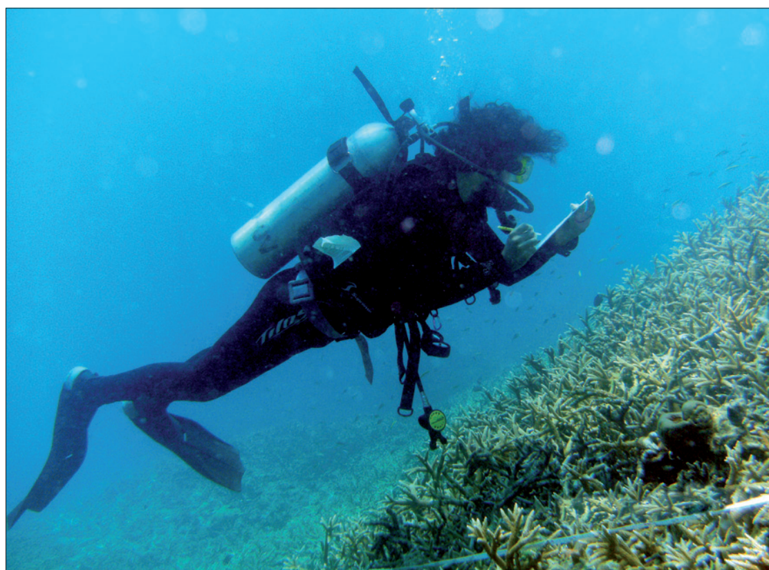
Sus investigadores exploran las riquezas del Golfo de México