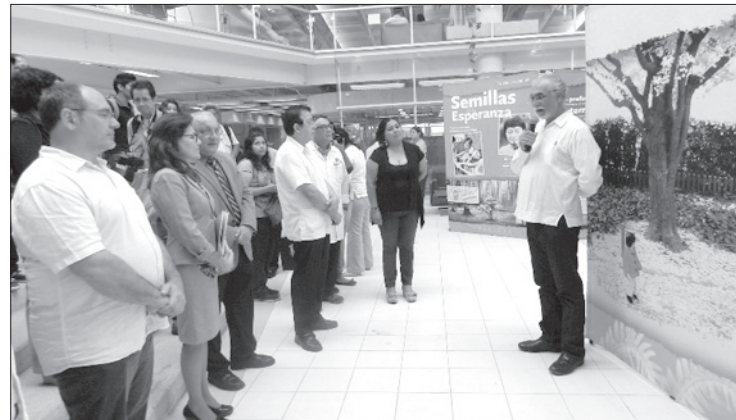
Aspecto de la exposición Semillas de la esperanza