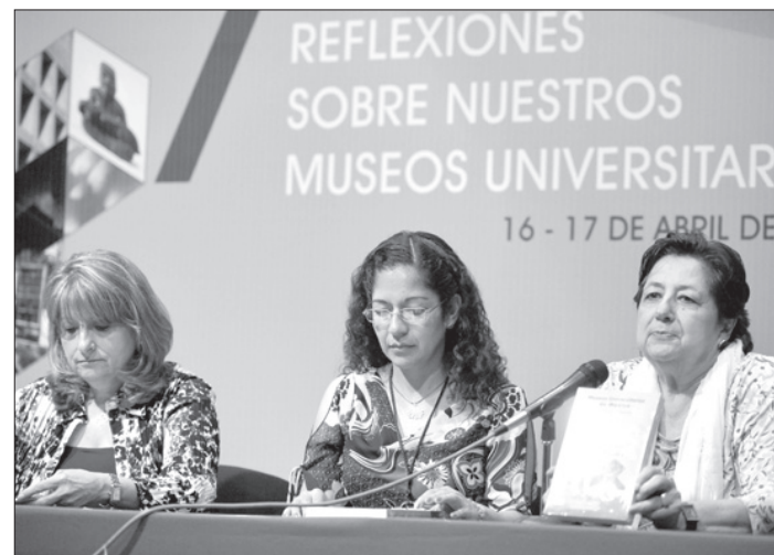
Presentación de Museos universitarios en México