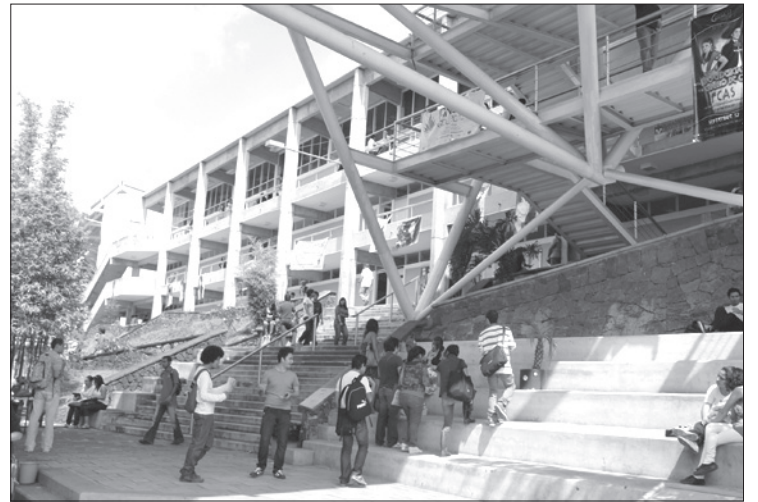
La FCAS, uno de los espacios beneficiados

Los equipos de videovigilancia serán instalados en espacios universitarios como, por citar algunos ejemplos, la Facultad de Ciencias Administrativas y Sociales (FCAS) y la Unidad de Humanidades en la región Xalapa; la Facultad de Ingeniería y el